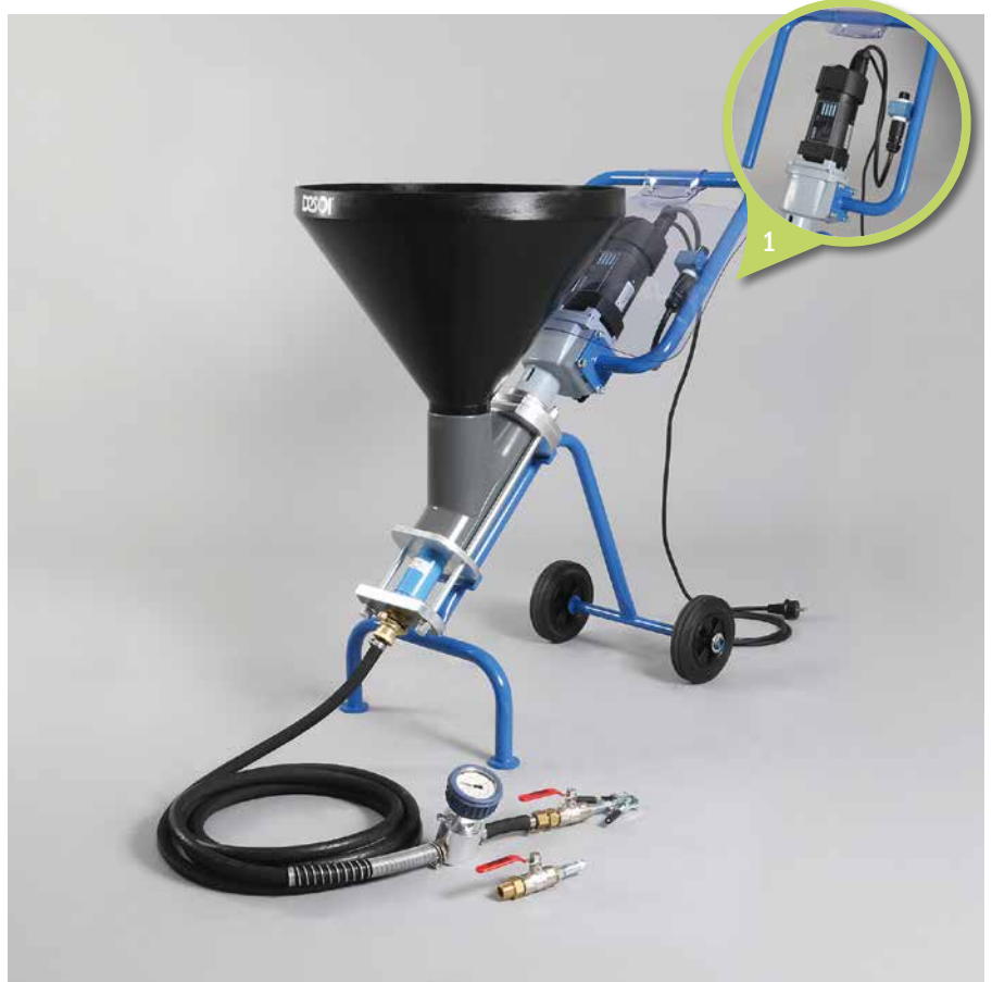
1. Stufenlose Fördermengenregulierung | Infinitely variable delivery rate regulation