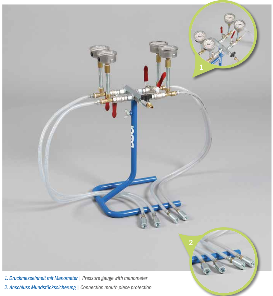
1. Druckmesseinheit mit Manometer | Pressure gauge with manometer

4 x connections: ball valve, manometer 0 – 25 bar, 1 m hose line, mouth piece with mouth piece protection