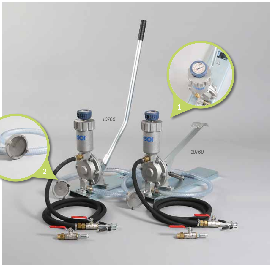
1. Druckspeicher mit Manometer | Accumulator with manometer

suction system, accumulator with manometer 0 – 25 bar, incl. instruction manual, No. 10913: Material hose (Ø 13 mm, 3 m long, detachable double nipple R ½"), No. 10920: Quick snap (LP ball valve R ½", max. 40 bar, free passage Ø 9 mm, detachable double nipple R ½"), No. 21232: LP ball valve R ½" (max. 40 bar, mouth piece, detachable double nipple R ½")