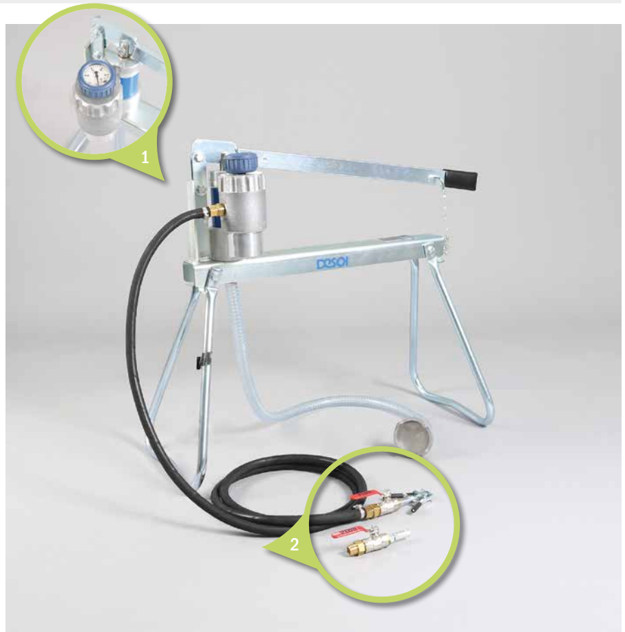
1. Druckspeicher mit Manometer | Accumulator with manometer