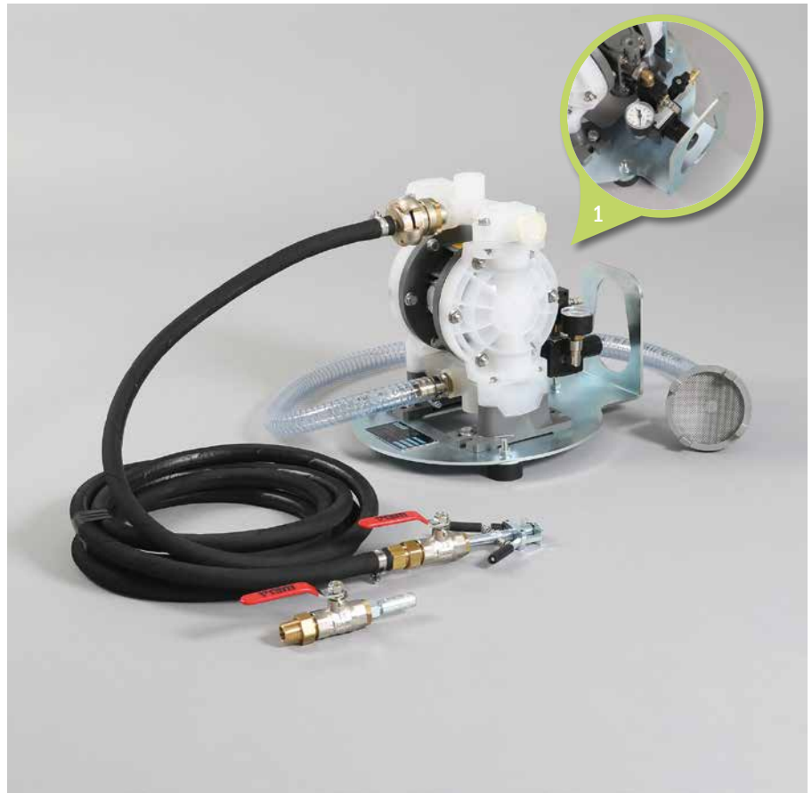
1. Druckminderer mit Manometer | Pressure reducer with manometer

No. 21232: LP ball valve R ½" (max. 40 bar, mouth piece, detachable double nipple R ½")