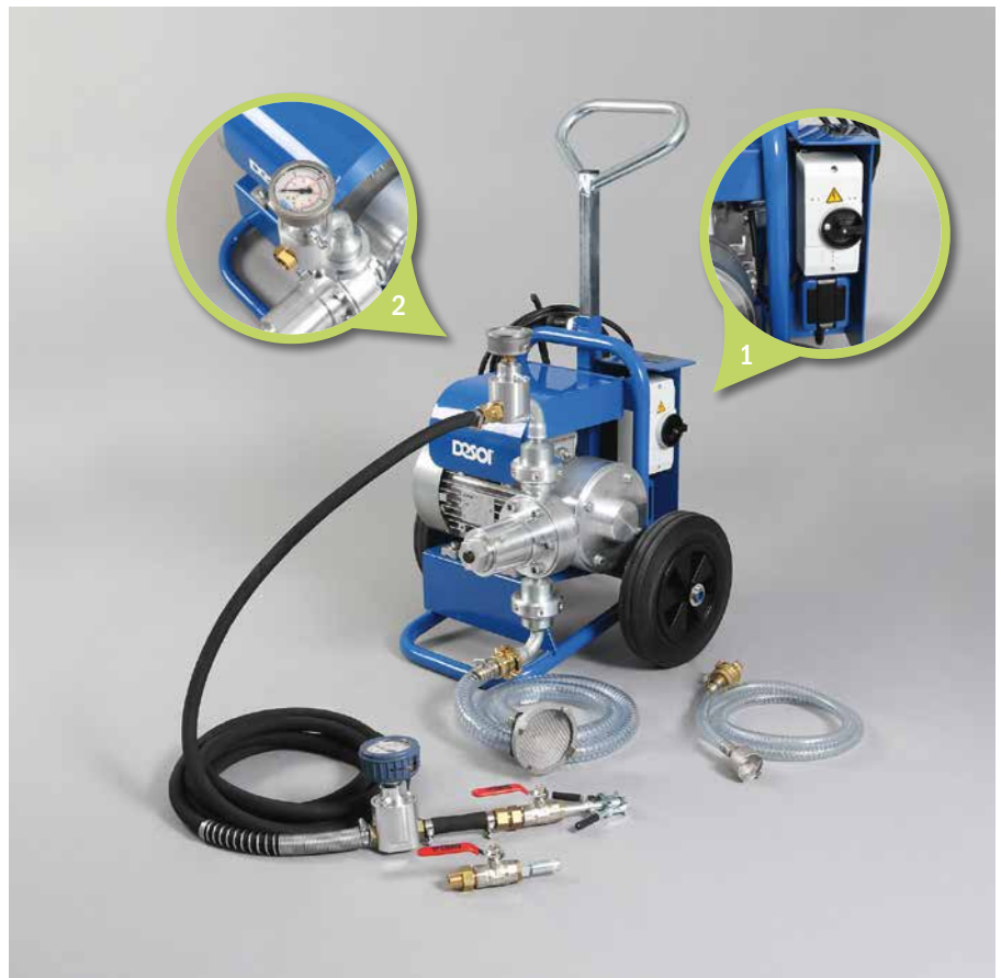
1. Hauptschalter | Main switch

No. 11402: Quick snap (LP ball valve R ½", 5 m material hose Ø 13 mm with detachable double nipple R ½", pressure gauge unit with manometer 0 – 40 bar, free passage Ø 9 mm, spring protection against buckling),