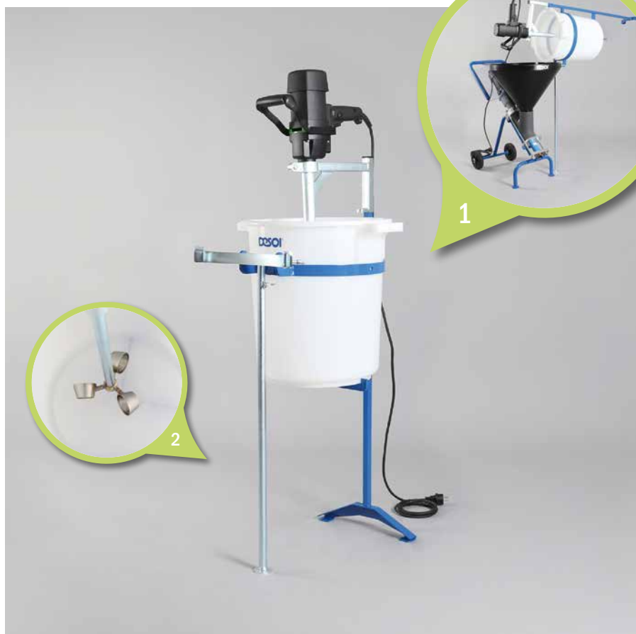
1. Anbaurührwerk für DESOI PowerInject SP20, gekippt | Attached mixer for DESOI PowerInject SP20, tilted 2. Becherrührer | Cone agitator