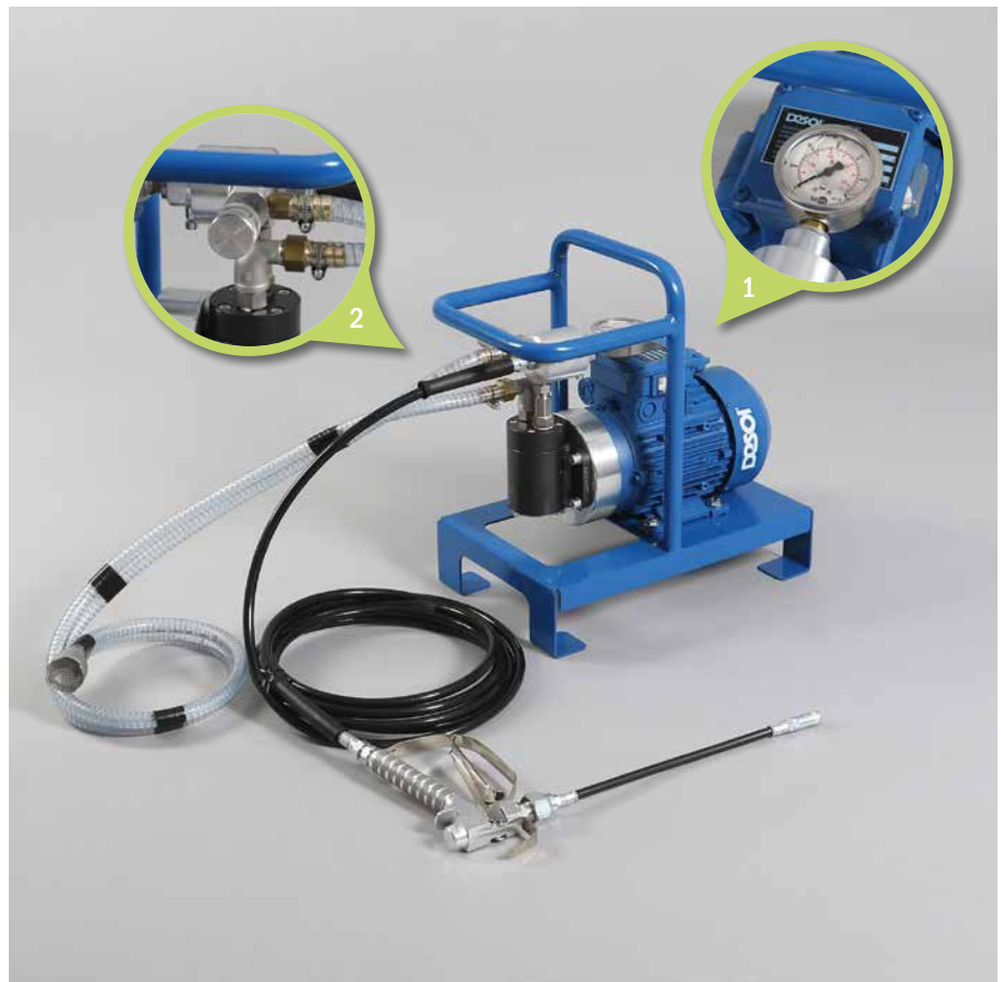
1. Druckmesseinheit mit Manometer | Pressure gauge unit with manometer